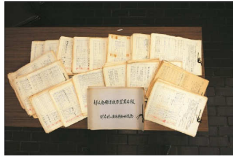
33,363人の婦人会館建設要望署名綴

昭和48年 堺市婦人団体連絡協議会が堺市長に婦人会館建設要望書提出（33,363人の署名）