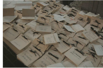
建設基金寄付協力者名簿の束

昭和34年 堺市婦人団体連絡協議会が女性の生涯学習拠点の建設に向け、募金活動開始（歯ブラシ5本100円を会員に販売するなど）