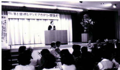
第1回 サカイレディスアカデミー開講式